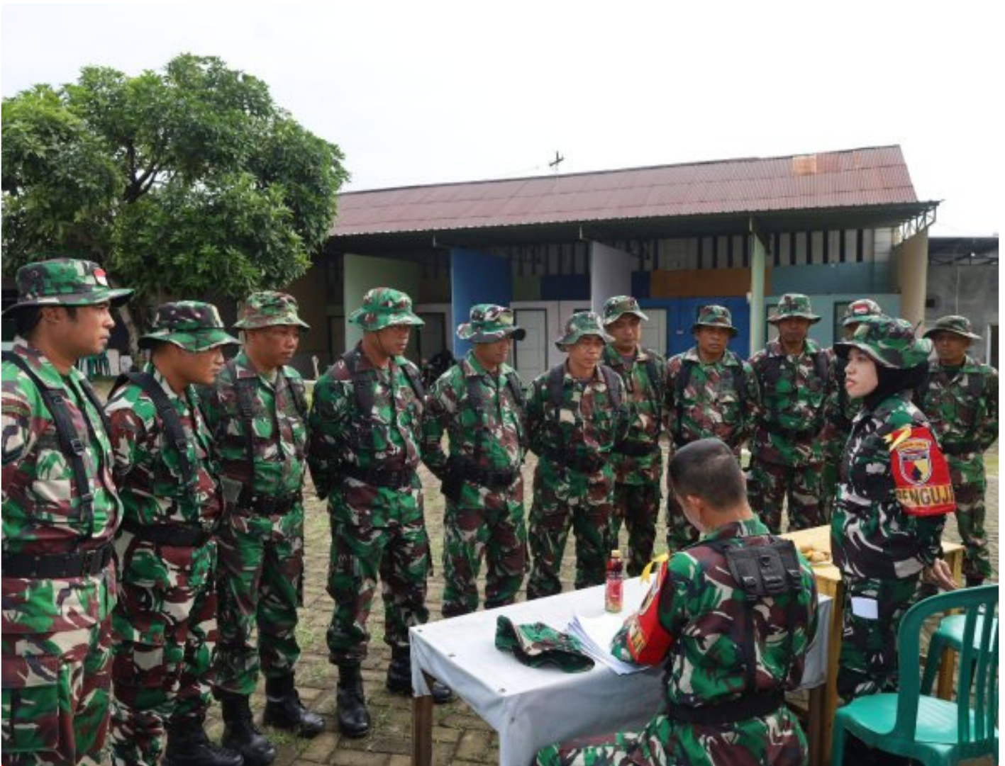
Tingkatkan Kemampuan Prajurit, Kodim 0804/Magetan Gelar UTP Teritorial

Magetan. Guna meningkatkan kemampuan Prajurit, Kodim 0804/Magetan menggelar kegiatan Uji Terampil Perorangan (UTP) Umum teritorial, di Taman Darmawangsa Kodim 0804/Magetan, Rabu (22/01/2025).