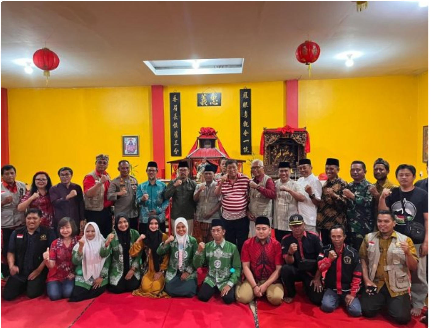
Danramil 0804/01 Magetan Bersama Forkopimca Hadiri Kegiatan Do'a Bersama Peringati Imlek Tahun Baru Saka 2576/2025

MAGETAN. - Komandan Koramil ( Danramil ) 0804/01 Magetan jajaran Kodim