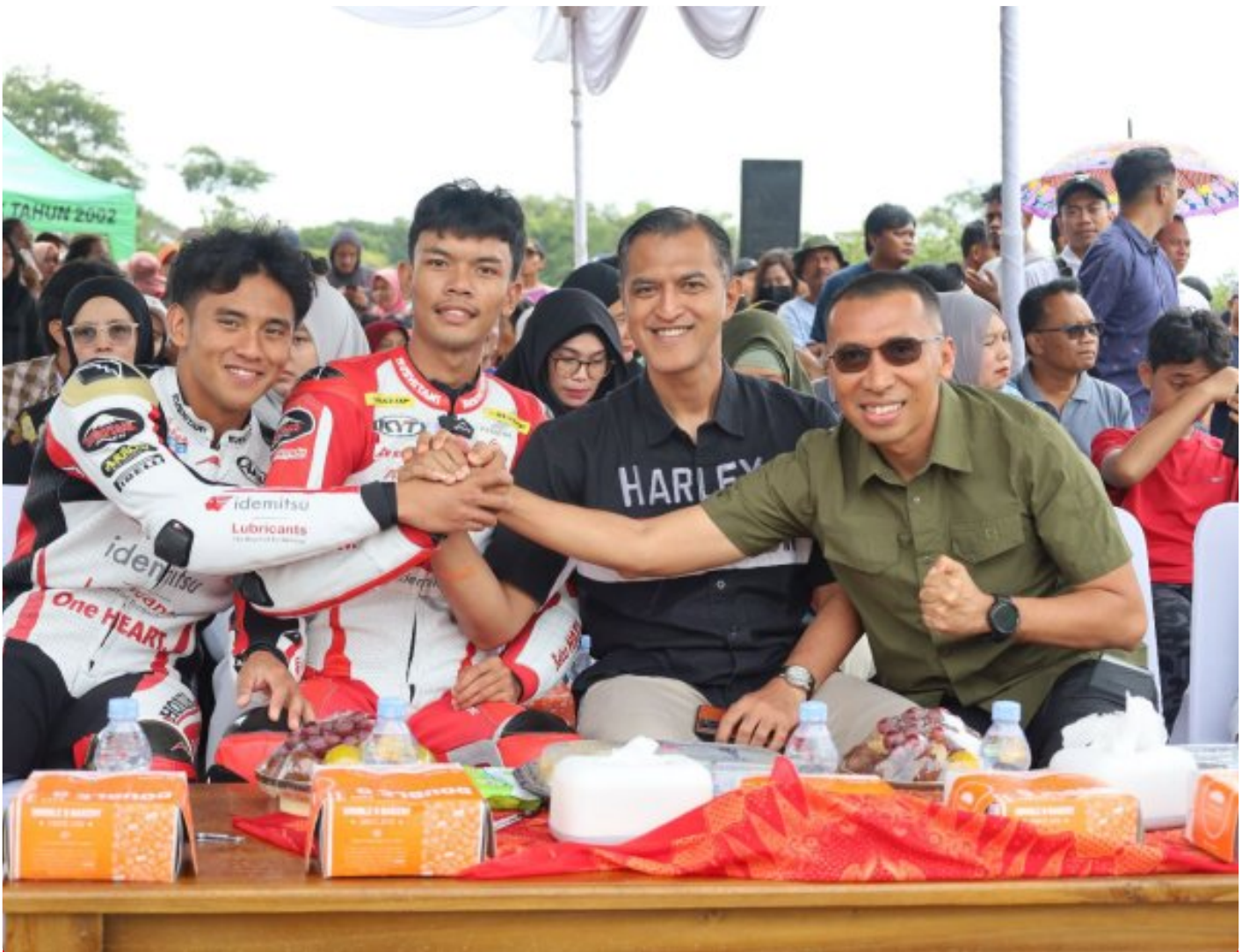
Dandim 0804/Magetan Hadiri Undangan Tinjau Sirkuit Magetan